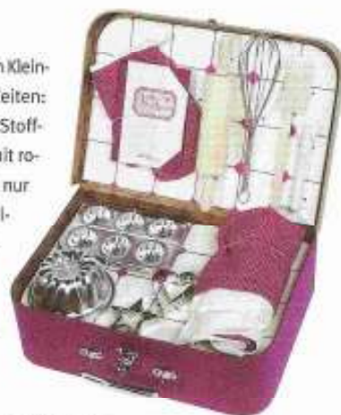
Das „Konditorhandwerk-Set“ liefert alles für kleine Küchenmeister.

Die Spielsachen von Moulin Roty aus der bretonischen Kleinstadt Nort-sur-Erdre wirken wie aus Großmutter's Zeiten: Schaukelpferde, Flugzeug-Laufräder, Holzküchen, Stoffpuppen, Teddybären mit Garderobe, Kinderkoffer mit romantischem Geschirr und Backformen. Alles scheint nur auf die kleinen Benutzer zu warten, um sie dann in eine andere Zeit zu entführen. Die Produkte gibt's im Fachgeschäft oder in verschiedenen Internet-Shops. (Moulin Roty, „Tee-Set“ im Koffer circa 50 €, „Konditorhandwerk-Set“ im Koffer circa 60 €)