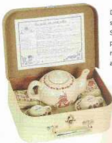
Wunderschöne Geschenkidee für kleine Puppenmütter: das Tee-Set im Kinderkoffer aus Alu.

Die Spielsachen von Moulin Roty aus der bretonischen Kleinstadt Nort-sur-Erdre wirken wie aus Großmutter's Zeiten: Schaukelpferde, Flugzeug-Laufräder, Holzküchen, Stoffpuppen, Teddybären mit Garderobe, Kinderkoffer mit romantischem Geschirr und Backformen. Alles scheint nur auf die kleinen Benutzer zu warten, um sie dann in eine andere Zeit zu entführen. Die Produkte gibt's im Fachgeschäft oder in verschiedenen Internet-Shops. (Moulin Roty, „Tee-Set“ im Koffer circa 50 €, „Konditorhandwerk-Set“ im Koffer circa 60 €)